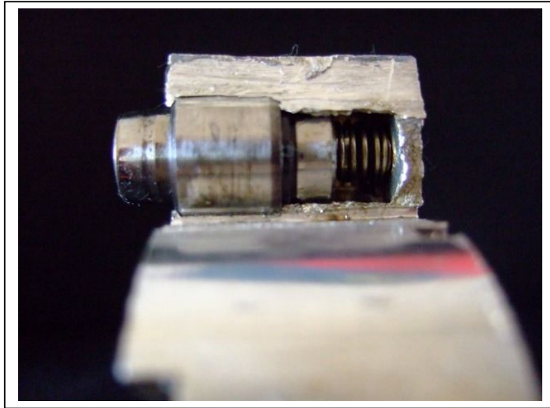
aufgesägte Führung Verriegelungsbolzen