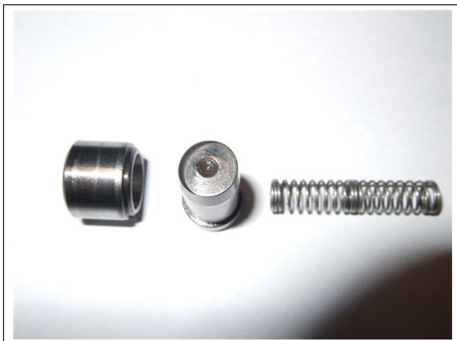
Detailansicht Verschleiß am Verriegelungsbolzen und gestauchte Feder