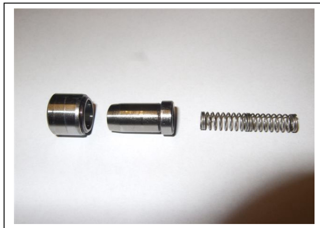
Einzelteile Verriegelungsanlage für Start